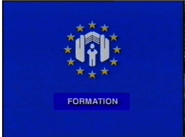
BOLZANO 2008 SANTINI

Provincia Autonoma di Bolzano - Alto Adige