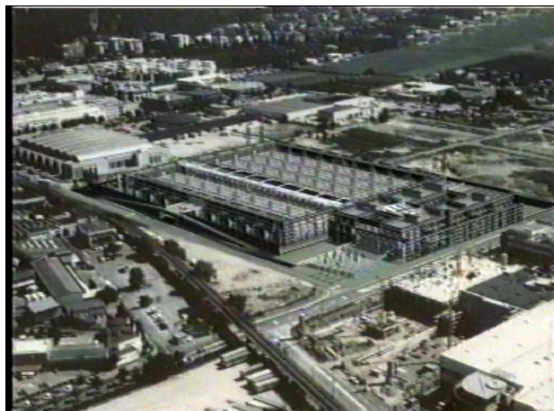
BOLZANO 2008 SANTINI

Provincia Autonoma di Bolzano - Alto Adige