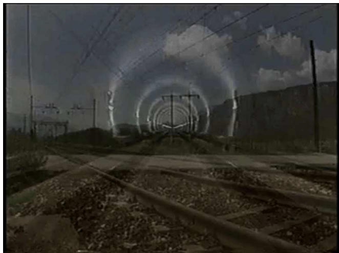
BOLZANO 2008 SANTINI

Provincia Autonoma di Bolzano - Alto Adige