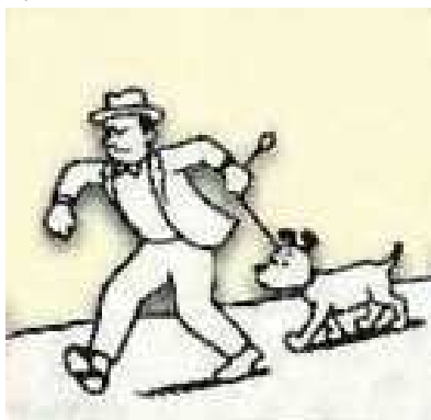
Figura professionale in uscita...