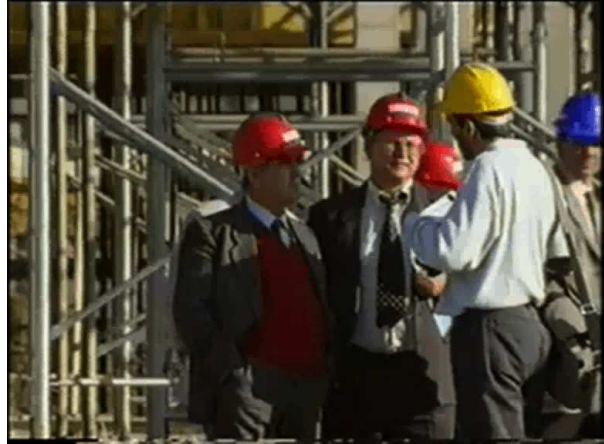
BOLZANO 2008 SANTINI

Provincia Autonoma di Bolzano - Alto Adige